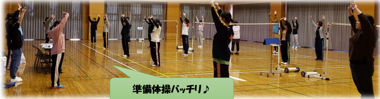
準備体操バッチリ♪

さて、今月のフォローアップでは「リフレッシュ研修」としてバドミントン大会を行いました。プリセプターの方々に参加いただき、楽しく運動しながら交流を深めました。今月から院内留学も始まりましたので、他部署の先輩方との交流は有意義なものとなりました。院内留学でもご指導宜しく申し上げます！！