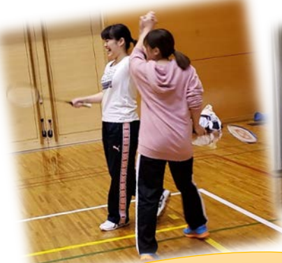
ピーコックパワー全開！！