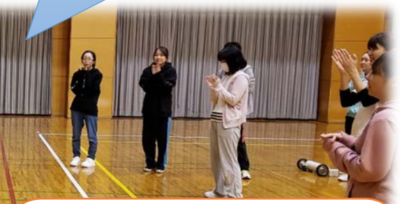
最後はみんなで輪になって☆ 悩みなどを先輩に相談・・・ 親身にアドバイスするプリセプターの姿を見て、ともに成長しているなーと感じました。貴重なお時間ありがとうございました！